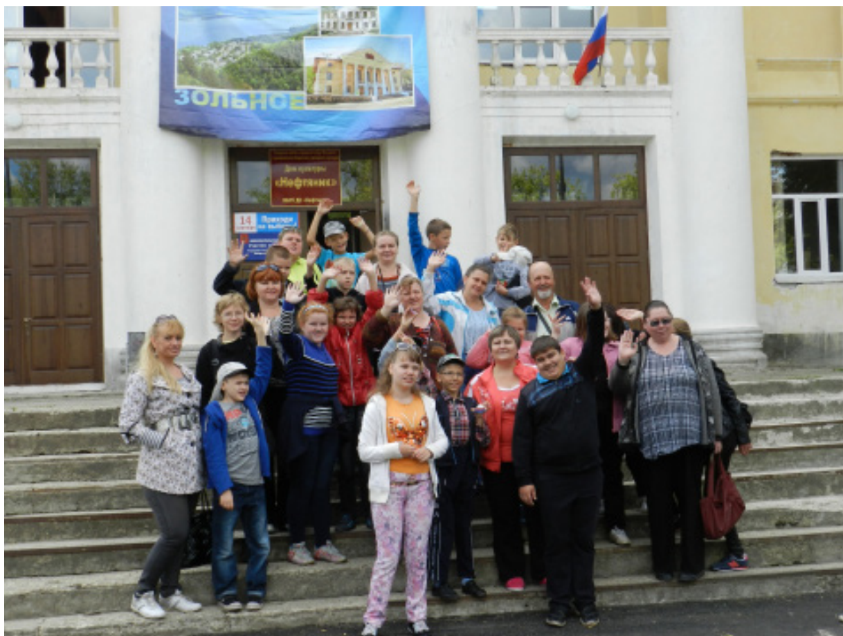
Поездка детей с ограниченными возможностями в Жигулевский заповедник стр.2

8 ноября - Фестиваль детского творчества «Серебряная птица»